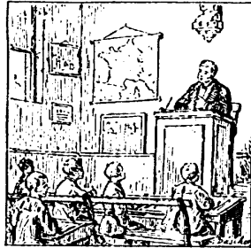
Il faut é cou ter at ten ti ve ment les le çons du maî tre.

Main te nant, mes pe tits a mis, vous sa vez lire ; c'est par ce que vous a vez é té as si dus* à l'é cole et que vous a vez é cou té les le çons de vos maî tres.